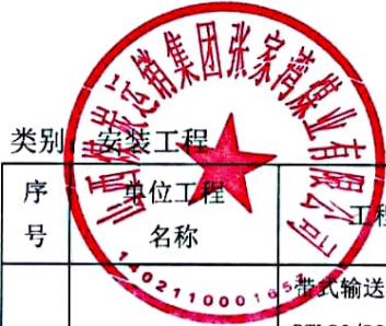
山西煤炭运销集团张家湾煤业有限公司已认证单位工程明细表